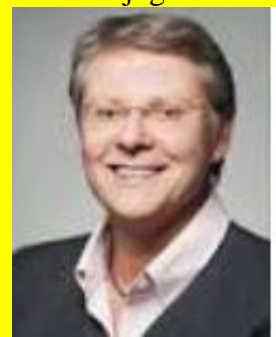
Béatrice MÉTRAUX Conseillère d'Etat