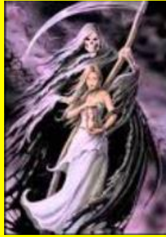
Aurore BARBE, aide-soignante