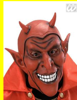
Guillaume PERROT juge cantonal